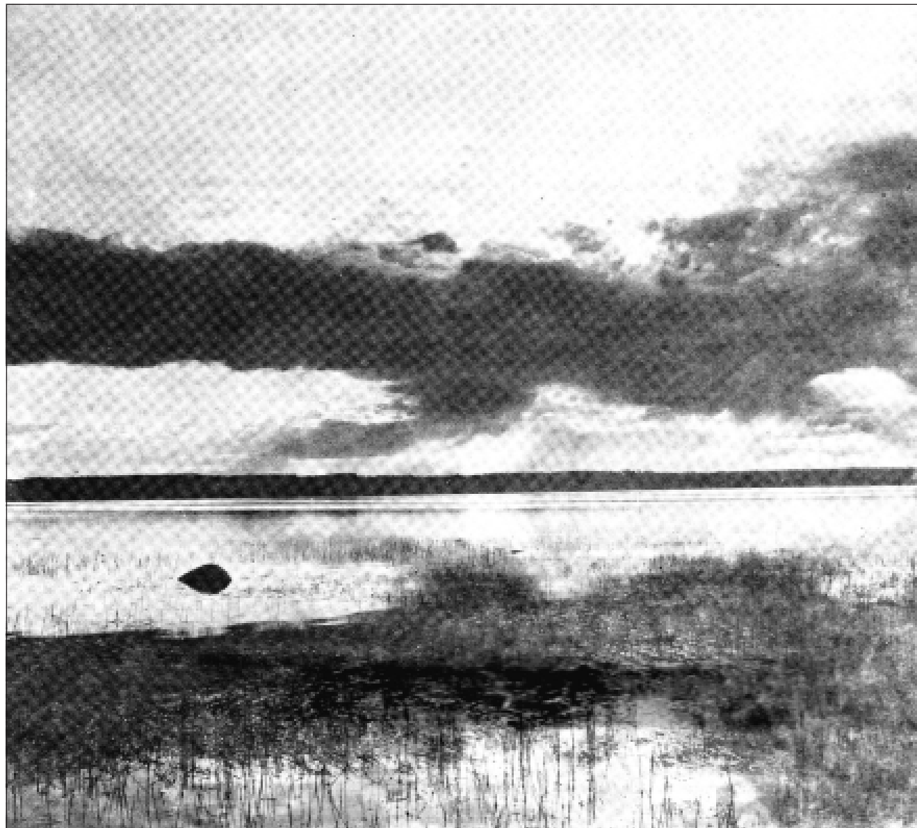
Фото Олега СЕМЕНЕНКО

И толпы животных и диких зверей, Просунув сквозь елки рогатые лица. К источнику правды, к купели своей Склонялись воды животворной напитокся.