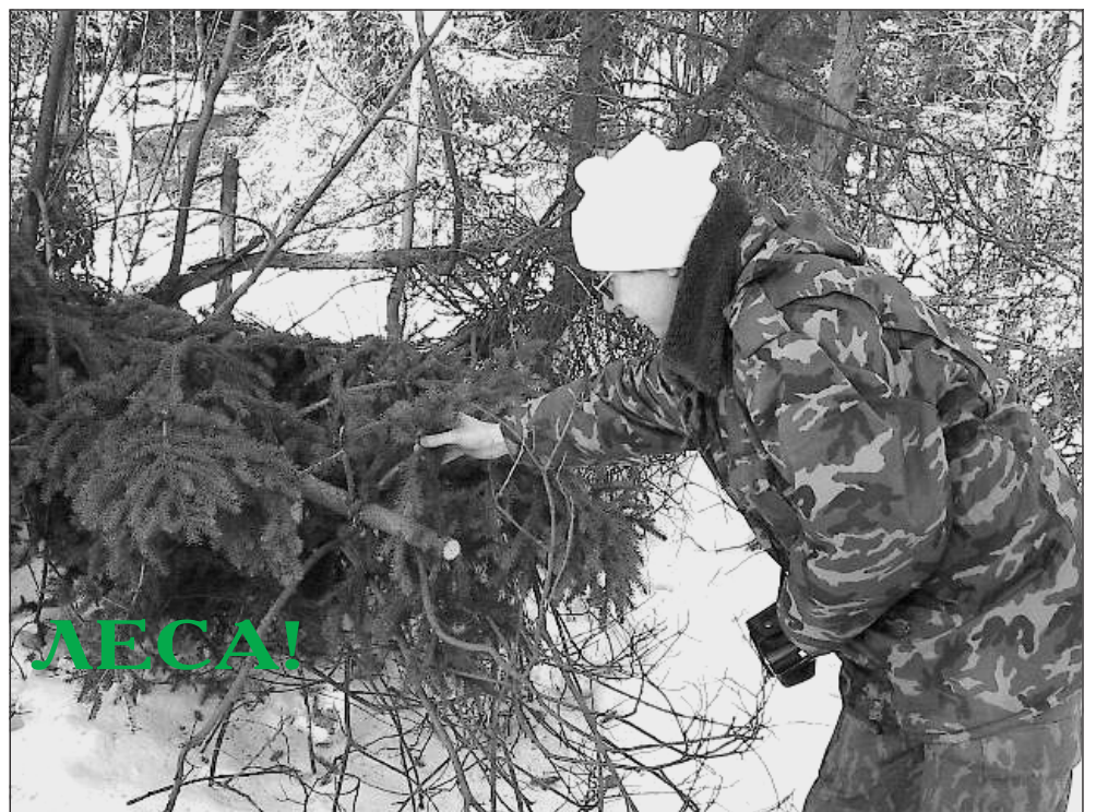
Участник рейда показывает незаконно спиленную ель.

Экологи серьёзно обеспокоены также и тем, что всё больше сжимается кольцо вокруг самой ценной территории – лесопарковой зоны города.